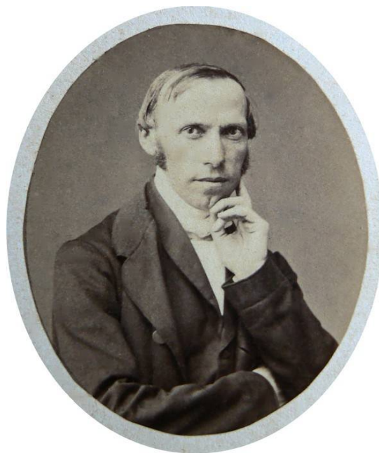
Alphonse CADIER en 1858