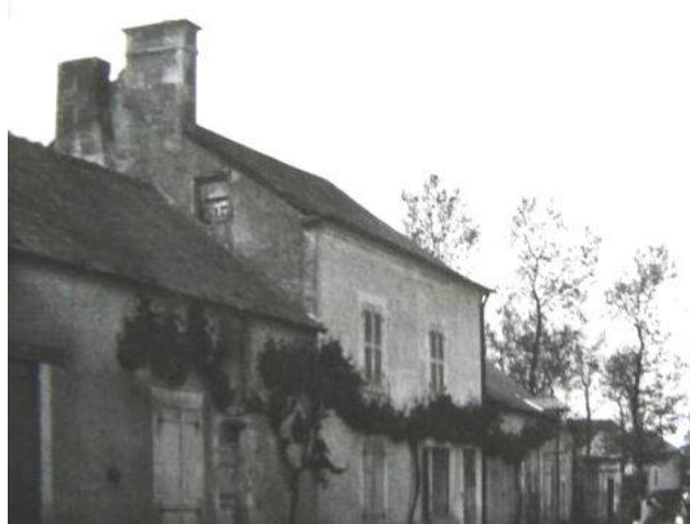
Maison Cadier à Asnières-les-Bourges